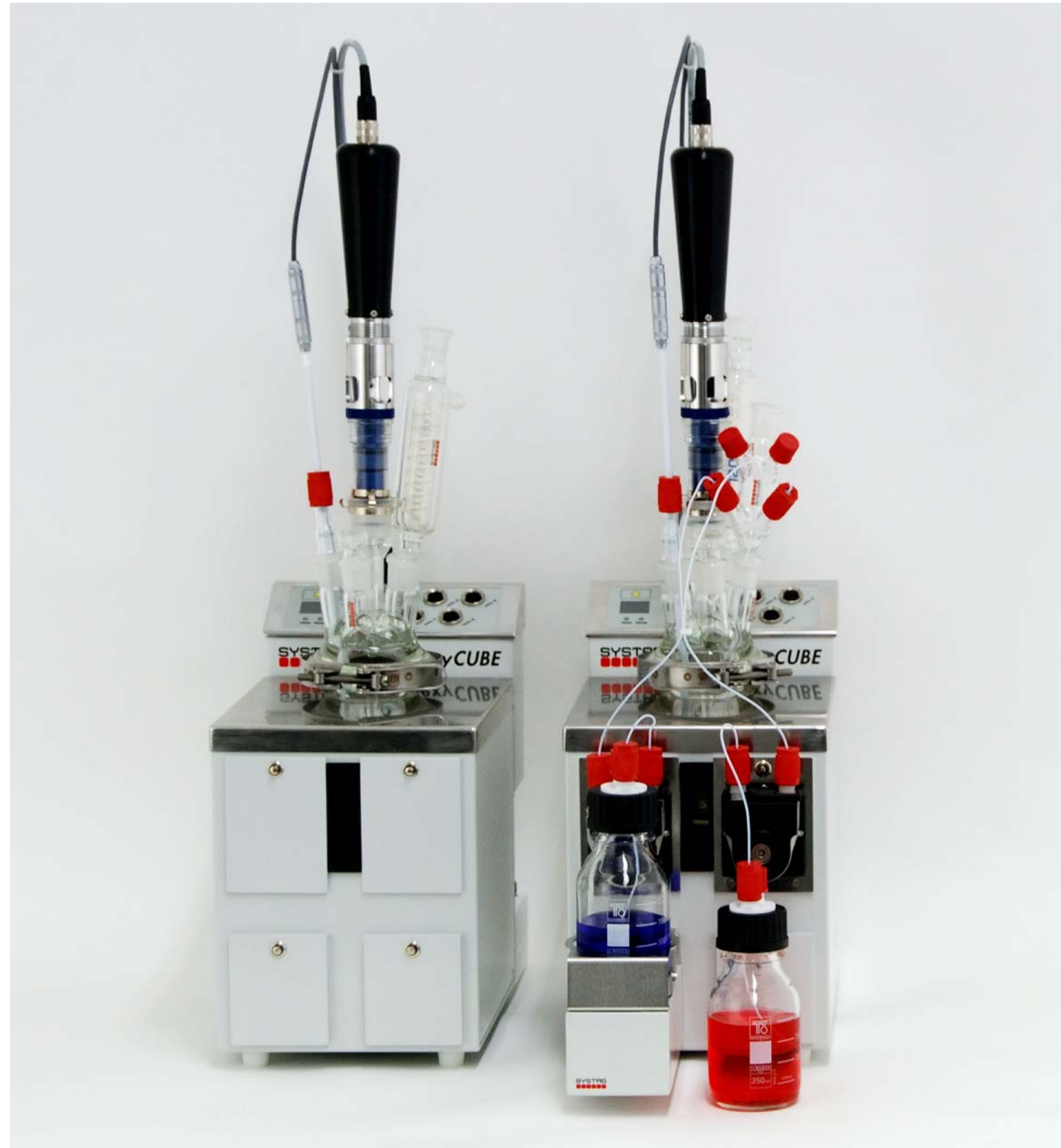
Hier eine 2-fache FlexyCUBE-Kombination: links ein FlexyCUBE ohne Dosierungen (ideal auch für einen Druckreaktor), rechts eine Einheit mit gravimetrischer Dosierung ab Waage und rechts daneben eine volumetrische Dosierung

Einfache Anschlüsse hinten: oben PC-Netzwerk, Mitte Zusatzgeräte, wie Ventile für Inertgas und Kühlwasser, unten Netzanschluss mit Netzschalter